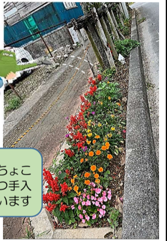
ちょこちょこ 少しずつ手入れしています