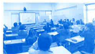
地域見守り連絡会