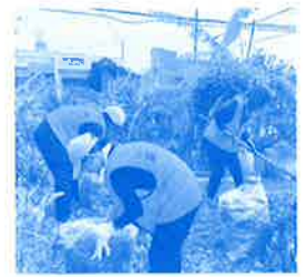
災害ボランティア活動