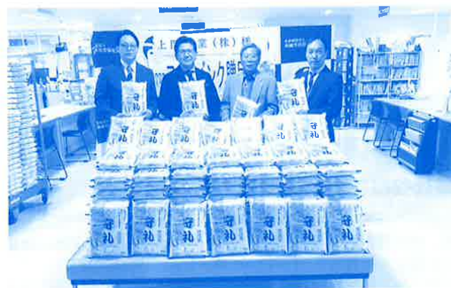
フード贈呈式 (上門工業株式会社)