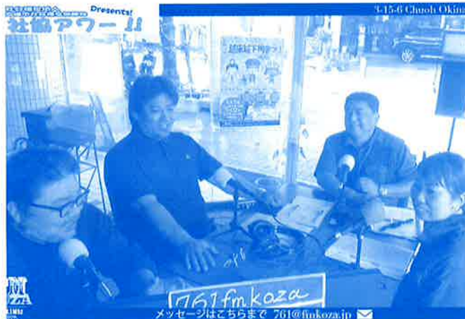
FMコザにて毎週水曜11:30よりオンエア中の「社協アワー!!」