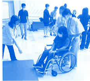
スマートライアルツアー