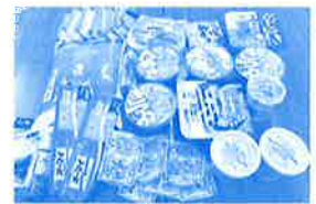
市民のみなさまからいただいた食料品