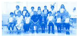
音訳ボランティア養成講座