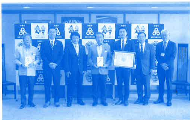
寄付金贈呈式 (株式会社設備技研)