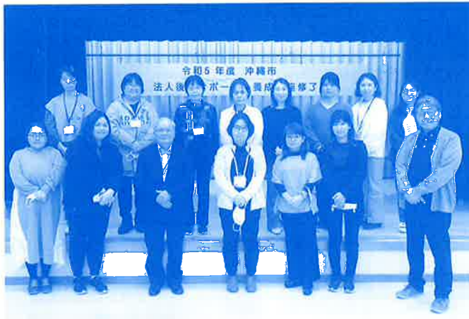
「法人後見サポーター養成講座(6期生)」修了式