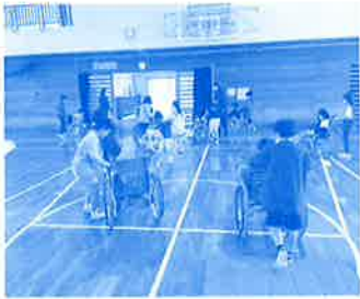
福祉体験学習 (安慶田小)