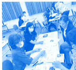
学習支援ボランティア養成講座