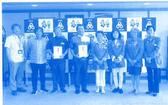
寄付金贈呈式 (コザパイロットクラブ)