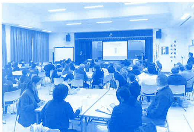
ふれあいのまちづくり事業「小地域ネットワーク実践報告会」