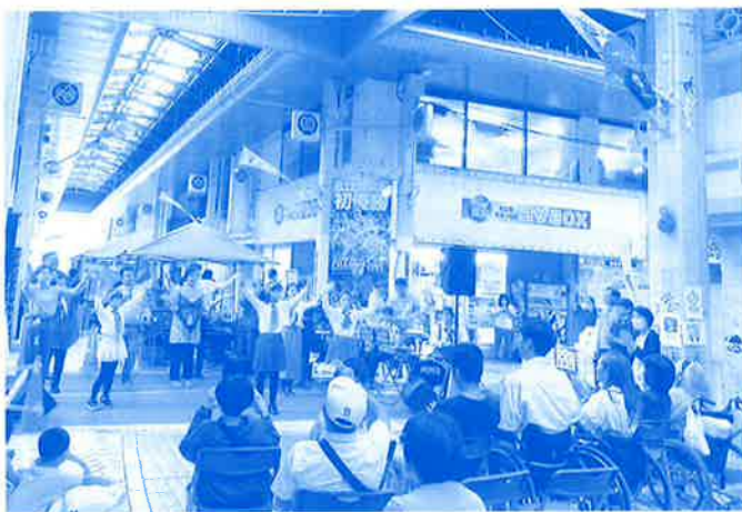
4年ぶりの開催となった「2023沖縄市福祉まつり」