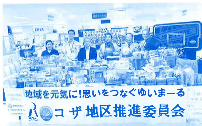
フード贈呈式 (ろうきんコザ地区推進委員会)